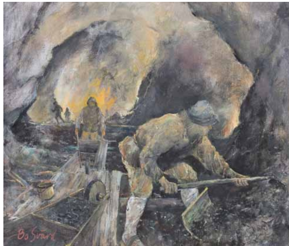
Fatare lastar brutet berg Kommande rekonstruktion